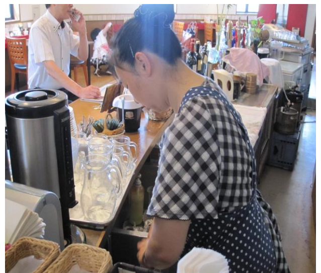
かいてんじゅんび ようす 開店準備の様子

しゅざい きょうりょく いたりあん ていず 取材にご協力いただいた ITALIAN T'sの みなさん、ありがとうございました！！