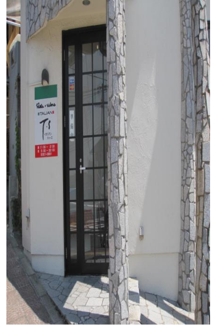
みせ がいかん お店の外観