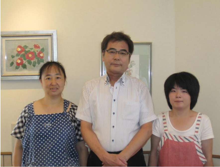
いたりあん ていず ITALIAN T'sのみなさん