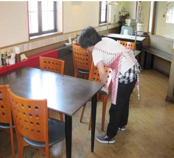
かいてんじゅんび せいそう ようす 開店準備の清掃の様子