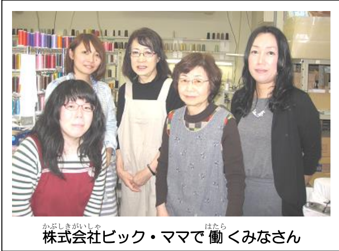
かぶしきがいしゃ はたら 株式会社ビック・ママで働くみなさん

かぶしきがいしゃ 《株式会社ビック・ママ》 ばしょ せんだいしあおぼくきためまち 場所：仙台市青葉区北目町 へいせい ねん がつげんざい (平成28年5月現在)