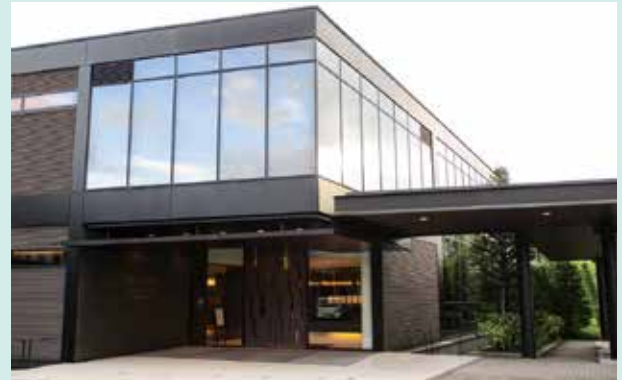
プルデンシャル生命保険株式会社 ドライデンカスタマーセンター

ドライデンカスタマーセンターでは、主に生命保険の契約管理業務や、営業社員のサポート、お客様からのお問合せへの対応などを行っています。