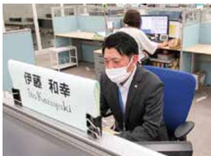
業務中の様子。後ろにトレーナーがおり、業務上の疑問が解決できる。

業務を通して、知識や経験が不足しているのを感じています。業界共通試験の受験や、IT関連の資格取得など、少しずつスキルアップして業務に生かしていきたいです。